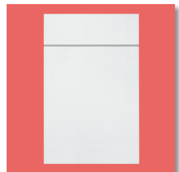
Keuze uit twaalf verschillende kleuren